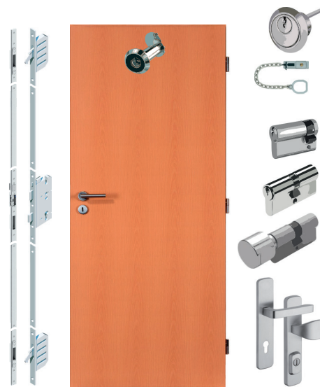
Protipožární dveře EI/EW 15-30