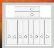
Galaxy.Fire 60 IT 10 Ordner / Folder

Die Ordner-Einstellungen ist ohne Innentresor. All divisions are without interior safes.