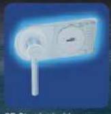
DB Standard Schloss Doppelbart-Hochsicherheitsschloss EN 1300 Klasse A. DB Standard Lock High security double bitted key lock EN 1300 Class A