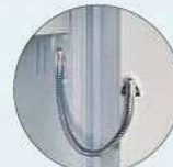
EMA-Vorbereitung EMA preparation

Alle Einteilungen sind ohne Innentresor. All divisions are without interior safes.