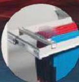
Teleskop-Hängeregister Telescopic filing frame for suspension

Die Ordner-Einstellungen ist ohne Innentresor. All divisions are without interior safes.