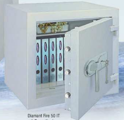
Diamant Fire 50 IT mit Doppelbart-Hochsicherheitsschloss / with high security double bitted key lock EN 1300 Class A