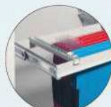
Teleskop-Hängeregister Telescopic filing frame for suspension