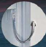
EMA-Vorbereitung EMA preparation