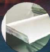
Teleskop-Fachboden Telescopic shelves to pull out