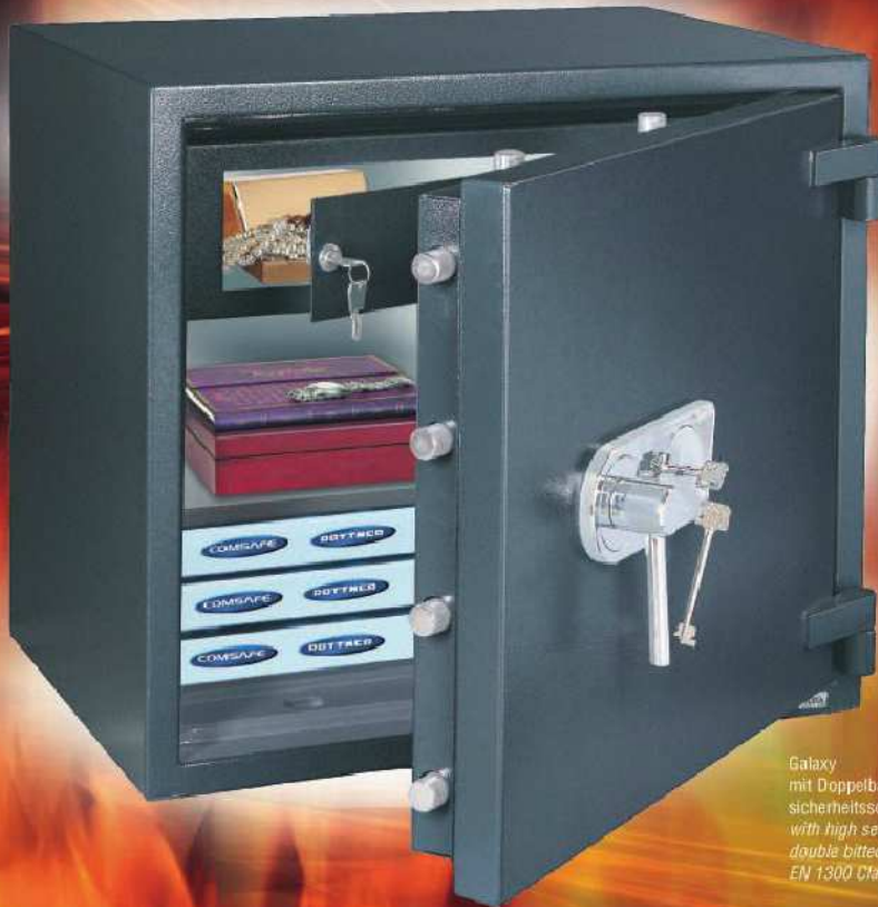
Galaxy mit Doppelbart-Hochsicherheitsschloss / with high security double bitted key lock EN 1300 Class A