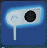
EL Elektronisches Sicherheitsschloss EN 1300 Klasse B (ohne Revision) inkl. 9 Volt Blockbatterie. EL Electronic security lock with EN 1300 Class B (without revision) included 9 Volt blockbattery.