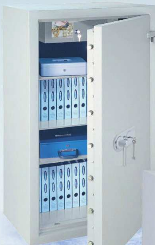
Diamant Fire 130 IT mit Doppelbart-Hochsicherheitsschloss / with high security double bitted key lock EN 1300 Class A

SAFES LESS THAN 1000 KG MUST BE ANCHORED INTO A CONCRETE FLOOR.