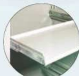
Teleskop-Fachboden Telescopic shelves to pull out