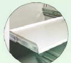
Teleskop-Fachboden Telescopic shelves to pull out