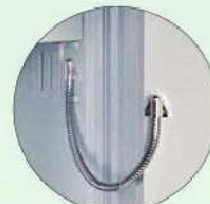
EMA-Vorbereitung EMA preparation