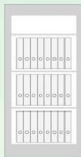
MegaPaper_160 24 Ordner / Folder