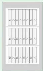
MegaPaper_140 24 Ordner / Folder

WERTSCHUTZSCHRÄNKE UNTER 1000 KG MÜSSEN IM BETONBODEN VERANKERT WERDEN.