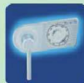
a) MC ab OPD-65 Mechanisches Zahlenkombinationsschloss EN 1300 Klasse A. a) MC of OPD-65 Mechanical combination lock EN 1300 Class A.