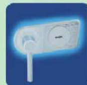
DB Standardschloss ab OPD-65 Doppelbart-Hochsicherheitsschloss EN 1300 Klasse A. DB Standard Lock of OPD-65 High security double bitted key lock EN 1300 Class A.