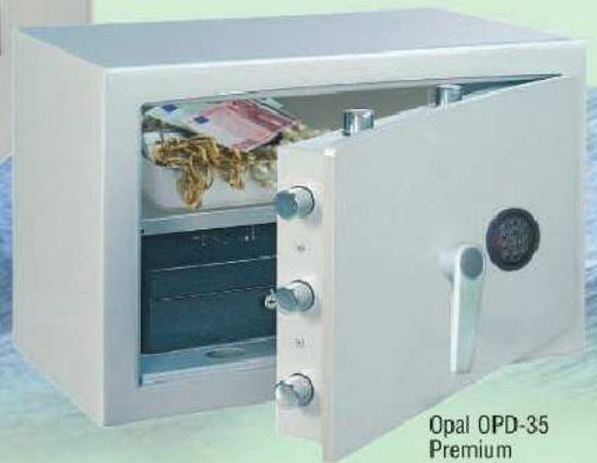
Opal OPD-35 Premium Standard