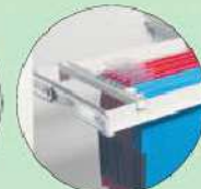
Teleskop-Hängeregistratur Telescopic filling frame for suspension