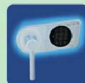
b) EL ab OPD-65 Elektronisches Sicherheitsschloss EN 1300 Klasse B (ohne Revision) mit 9 Volt Blockbatterie inklusive. b) EL of OPD-65 Electronic security lock with EN 1300 Class B (without revision) incl. 9 Volt block battery.