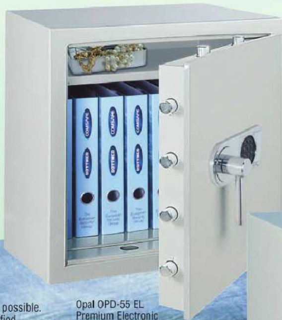
Opal OPD-55 EL Premium Electronic Abb. ohne Innentresor / without inner safe

SAFES LESS THAN 1000 KG MUST BE ANCHORED INTO A CONCRETE FLOOR.