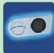
b) EL OPD-55 Elektronisches Sicherheitsschloss EN 1300 Klasse B (ohne Revision) mit 9 Volt Blockbatterie inklusive. b) EL OPD-55 Electronic security lock with EN 1300 Class B (without revision) included 9 Volt block battery.