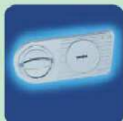
DB Standardschloss OPD-55 Doppelbart-Hochsicherheitsschloss EN 1300 Klasse A. DB Standard Lock OPD-55 High security double bitted key lock EN 1300 Class A.