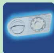
a) MC OPD-55 Mechanisches Zahlenkombinationsschloss EN 1300 Klasse A. a) MC OPD-55 Mechanical combination lock EN 1300 Class A.