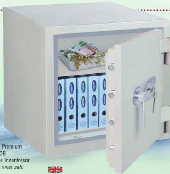
Opal-Fire Premium OPD-65 DB Abb. ohne Innentresor / without inner safe