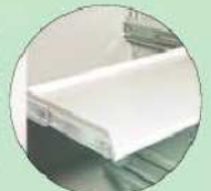
Teleskop-Fachboden Telescopic shelves to pull out