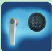
DB Standardschloss OPD-35 und OPD-45 Doppelbart-Hochsicherheitsschloss EN 1300 Klasse A. DB Standard Lock OPD-35 and OPD-45 High security double bitted key lock EN 1300 Class A.