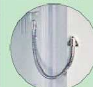
EMA-Vorbereitung EMA preparation

OPAL-FIRE: EMA-Vorbereitung nicht möglich.