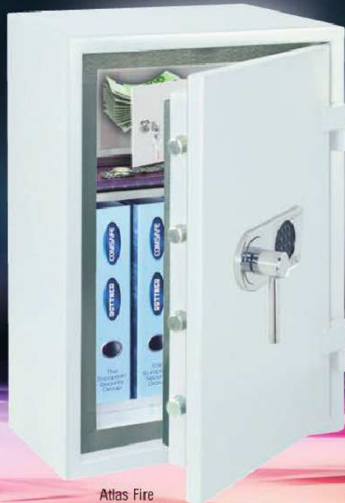
Atlas Fire Premium EL