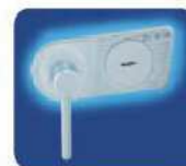
DB Standardschloss EN 1300 Klasse A für Samoa-65, 85 und 160. Doppelbart Hochsicherheitsschloss mit Schloßschutzpanzer aus Mangan-Hartstahl.

SAFES LESS THAN 1000 KG MUST BE ANCHORED INTO A CONCRETE FLOOR.