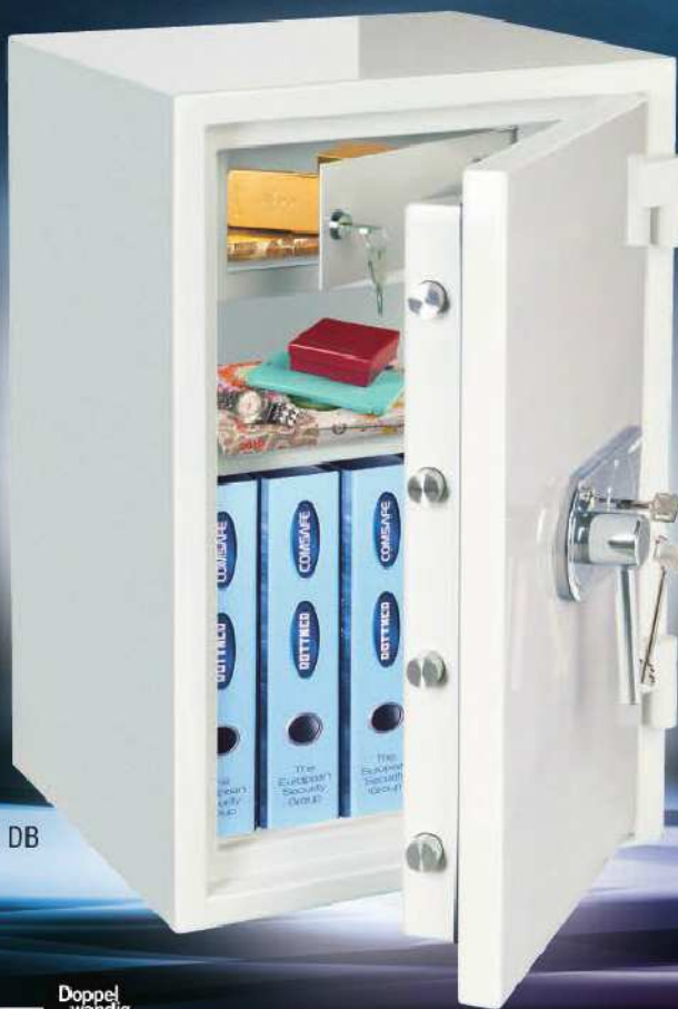
Atlas Fire Exclusiv DB

Designed mit 155 kg Einbruchschutz 30 min Feuerschutz Geprüft in Germany