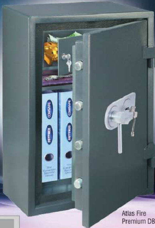
Atlas Fire Premium DB