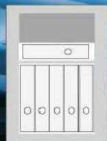
Atlas Fire Exclusiv 6 Ordner / Folder

Individual high-gloss piano lacquer finish Ask us – free advice. Various options are possible. • Real-goldplated lock fitting • Different colors • Various interiors